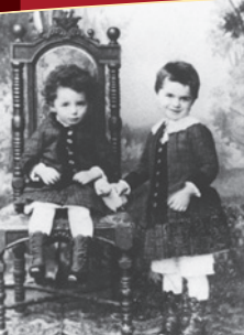
Сестрата на Рудолф Щайнер Леополдине (седнала) и Р. Щайнер (права) - около 1866 година