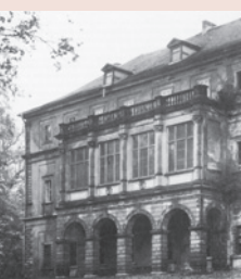
Архив на Гюте и Шилер във Ваймар