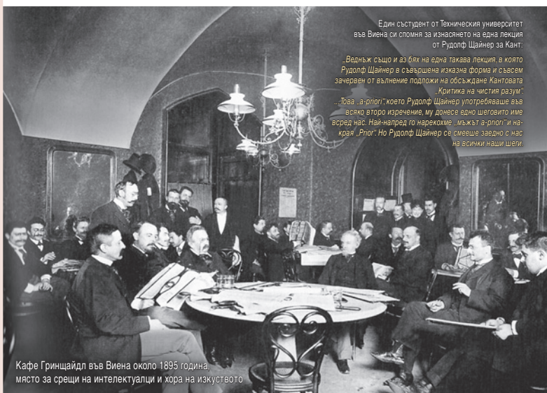
Един състудент от Техническия университет във Виена си спомня за изненаването на една лекция от Рудолф Щайнер за Кант:

Работата в архива Рудолф Щайнер приключва през 1896 година. Своите изследвания върху Гюте той обобщава в книгата си „Гютевият мироглед“ .