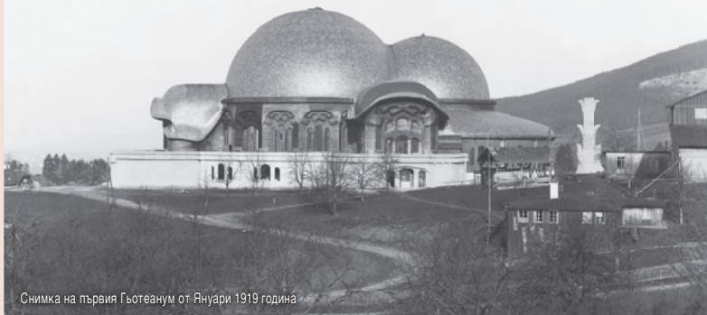
Снимка на първия Гьотеанум от Януари 1919 година

„За мое учудване при този разговор изживях най-голямата вътрешна свобода, която никога съм изпитвал, застанал пред никого. И при това човек си представя, че отива при Рудолф Щайнер, големия поетствен, който прозира други, че човек стои напълно прозрачен пред него - и очаква голямо притеснение. За мое учудване беше точно обратното. Аз се чувствах по-свободен от всякога, като приет в един друг свят, в който има значение само най-същественото.“