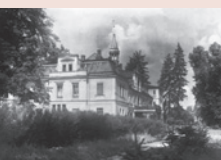
Землът Кобринц, Юни 1924 година