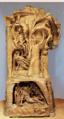
Девет метра високата статуя на „Представителят на човечеството“