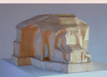
Модел на новия Гьотеанум от Рудолф Щайнер