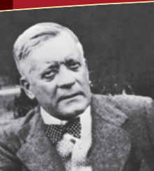
Граф фон Поелер-Ходитц