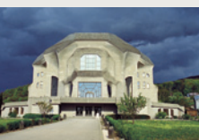
Вторият Гьотеанум източната страна