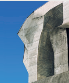
Детайл от северната страна на втория Гьотеанум