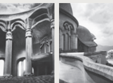
Първият Гьотеанум: Пластично оформление отвътре и отвън