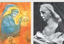
Първият Гьотеанум: Рисунки на тавана на големия купол, мотивът на Фруст Модел на главата на Христос за дървената скулптора „Представителят на човечеството“