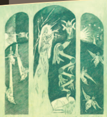
Първият Гьотеанум: Зеленият прозорец на север, гравирен от Ася Тургенева