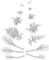
Листа метаморфоза на скъбиозата (кръставо биле, сакригизма) от зародишните листа до цветата

Обикновените ежедневни мисли са абстрактни огледални отражения от формирани идеи, които действат в природата. Те не са погрешни, а са като увехнали листа в сравнение с цялото живо растение. Правят ли се упражнения, както ги описва Р. Шайнер, мисленето става подвижно и живо, така че човек може да схване не само понятия и логични структури, а процеси и преобразувания. Този вид мислене Шайнер нарича имагинация . Самото преобразуване се вижда като времеви процес зад различните форми. Всички организирани функции например са такива процеси, които се проявяват като промени във физическото. При едно растение това много хубаво се вижда в промяната на формата на листата – от зародишните листа до цветата.