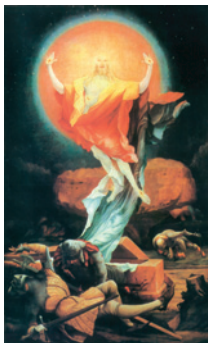
Гроневалд, Възкресение, Детайл от изображение на отпращане в музея „Год липпите“, Коплар

Във фазата на чисто духовното съществуване между смъртта и новото раждане човекът преработва изживяното в земния живот. То се превръща в способности, с които той е надарен през следващата инкарнация. Р. Шайнер открива, че има не само възходящо, но и низходящо развитие. Чрез зависимост и вина човекът изоставя назад въпреки своите способности. Той иска да изправи неморалните си егостични постъпки, които са донесли вреда на другите, защото те означават крачки назад в неговото собствено развитие. Последните на неговите действия за събития на другите и за природата остават като факти в света и отново го пресрещат в един следващ живот.