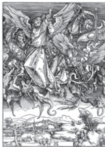
Албрехт Дюрер, Апокалиптическия цикъл, „Михаил в борба с дракона“