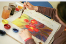
При художествената терапия