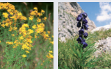
Лечебни растения: кантарион (Hypericum) и самаякитка (Aconitum napellus)