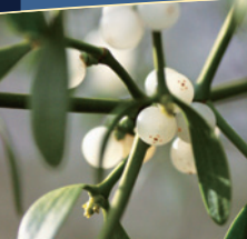
Антропософската ракова терапия използва лечебни средства от екстракти, получени от белия изел