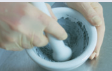
Производство на лекарства: разтрощаване в хаваче