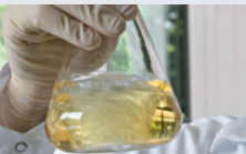
Производство на лекарства: потенциране