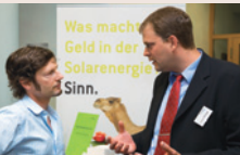
Разговор с клиенти в ГИС-банка, първата социално-екологична кооперативна банка