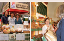
Трайно производство и почтена търговия от засаждането или развъждането до продажбата