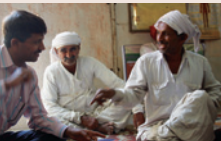
Съветване на био-земеделци в Кучч, Индия, договорен партньор на фармацевтичната фирма WALA