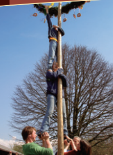
Заведно към високи цели. Бушберглюф, една „Community Supported Agriculture“