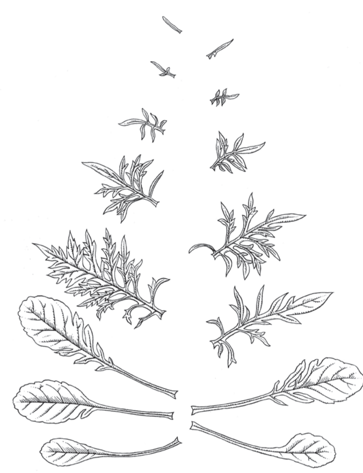
Метаморфоза листка скабіозу від зародкового листка до квітки

І як такий розвиток може відбуватися, Р. Штайнер неодноразово показує, наприклад, у книзі „Як досягти пізнання вищих світів?“ Наші звичні повсякденні думки є абстрактними відображеннями тих формуючих ідей, які в природі діють. Вони не є неpravильні; вони лиш схожі на зів'ялий лист у співставленні з усією живою рослиною. Якщо виконувати вправи так, як їх описує Рудольф Штайнер, мислення стає гнучким та живим. Так можна досягнути не лише поняття та логічні структури, а й процеси та всілякі перетворення. Штайнер називає цей спосіб мислення імагінацією . Вглядаючись у різноманітні форми, імагінація бачить за ними перетворення як процес, що протікає в часі. Усі органічні функції, до прикладу, є такими процесами, що проявляються у фізичному світі як змінювання. Дуже красиво виглядає таке змінювання форм у листя рослини від зародкового листка до квітки.