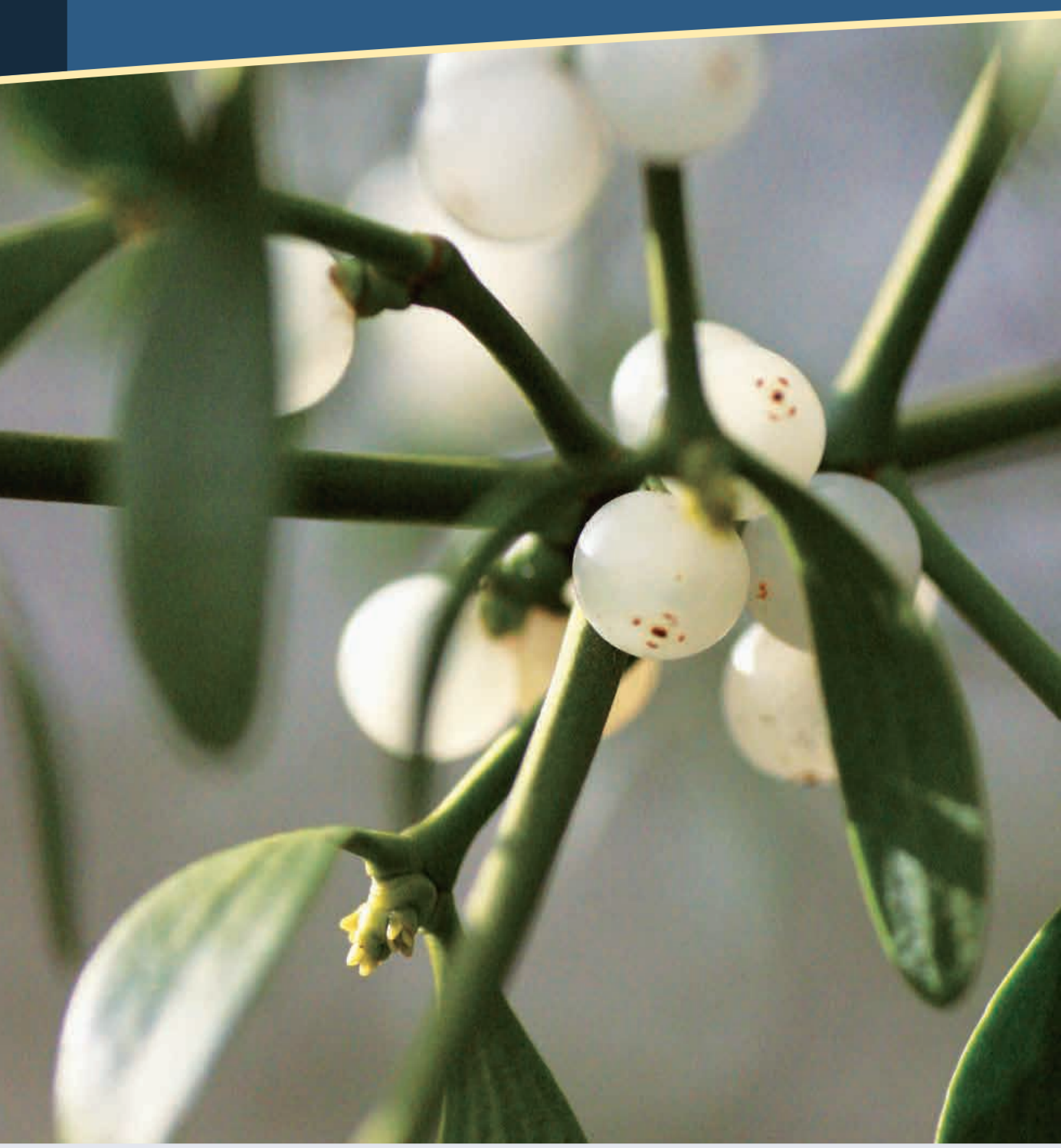
Антропософські медпрепарати з екстракту омели застосовують при лікуванні раку