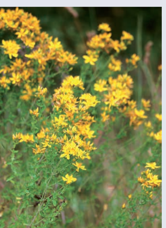
Цілючі рослини: звіробій (Hypericum) та борець, аконіт (Aconitum napellus)