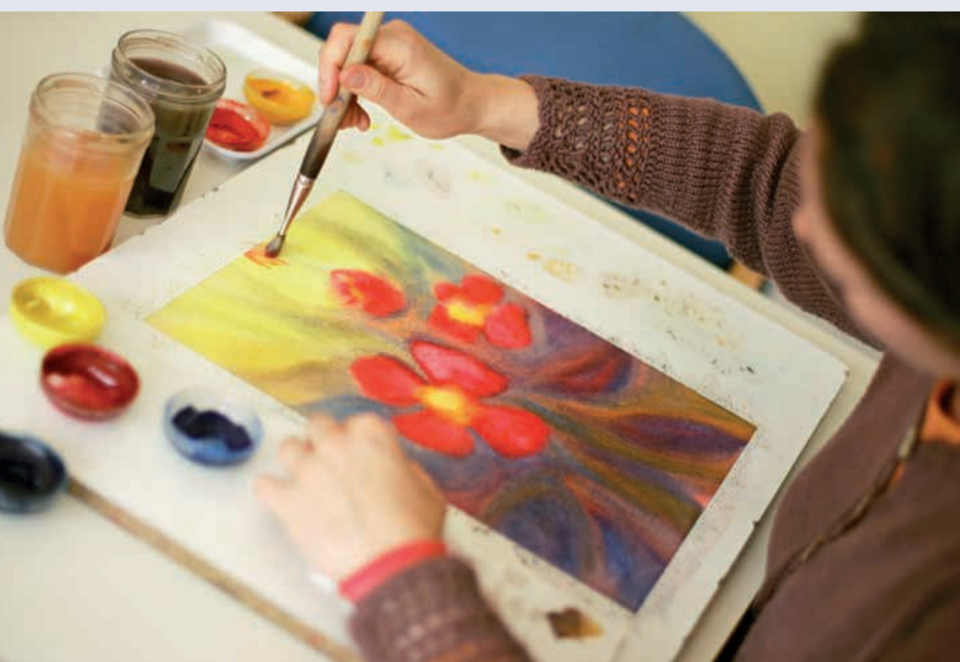
Під час терапії живописом