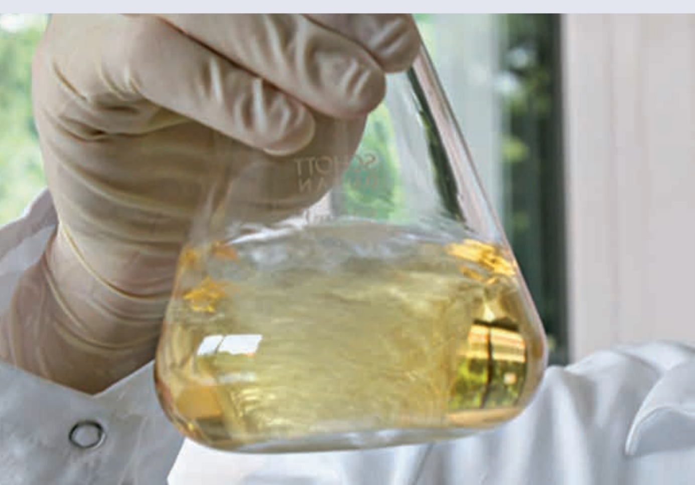
... і гомеопатичне потенціювання